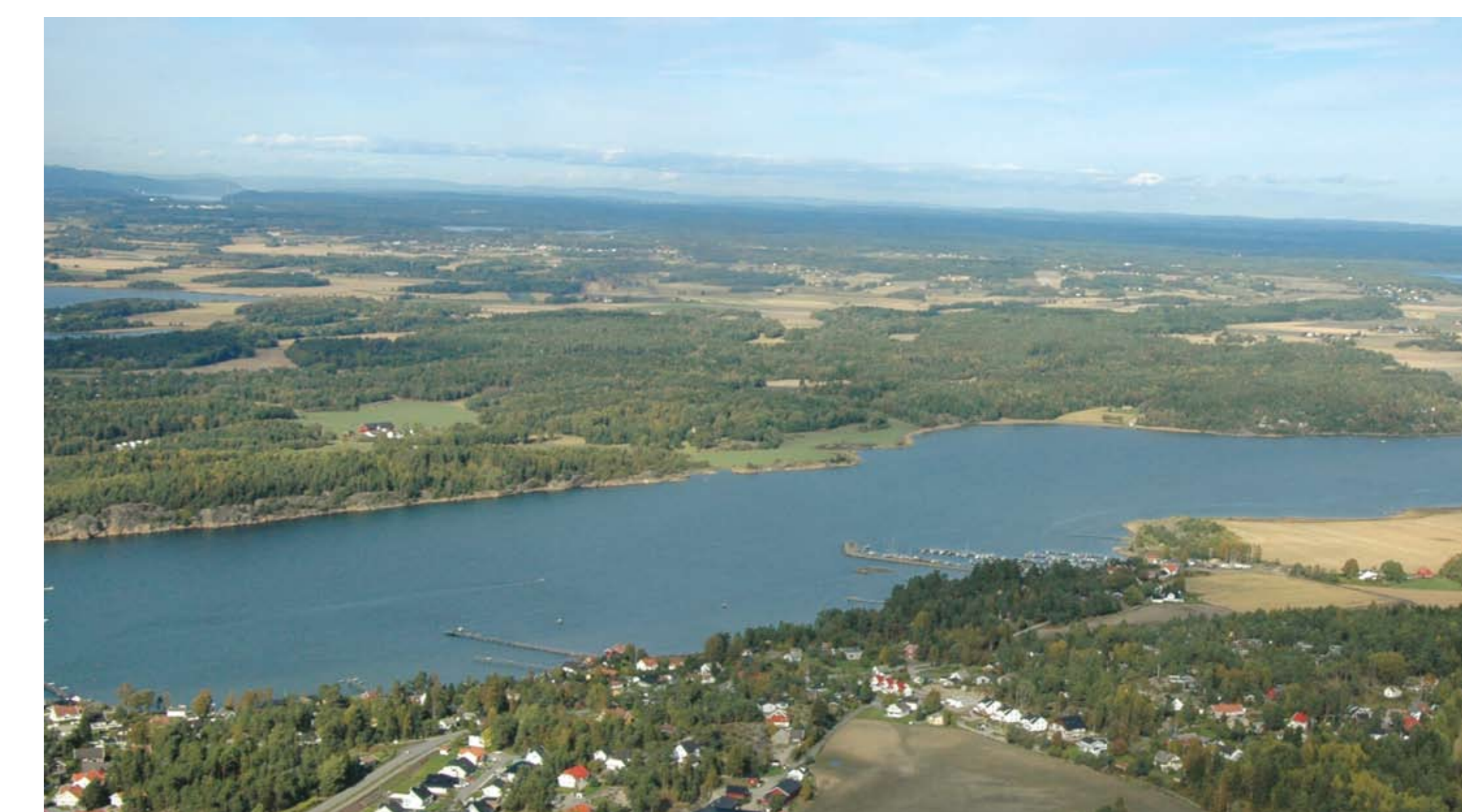
Røstad sett fra Saltnes

Navnet betyr rydningssted og gården er fra middelalderen, fra tiden før svartedauen.