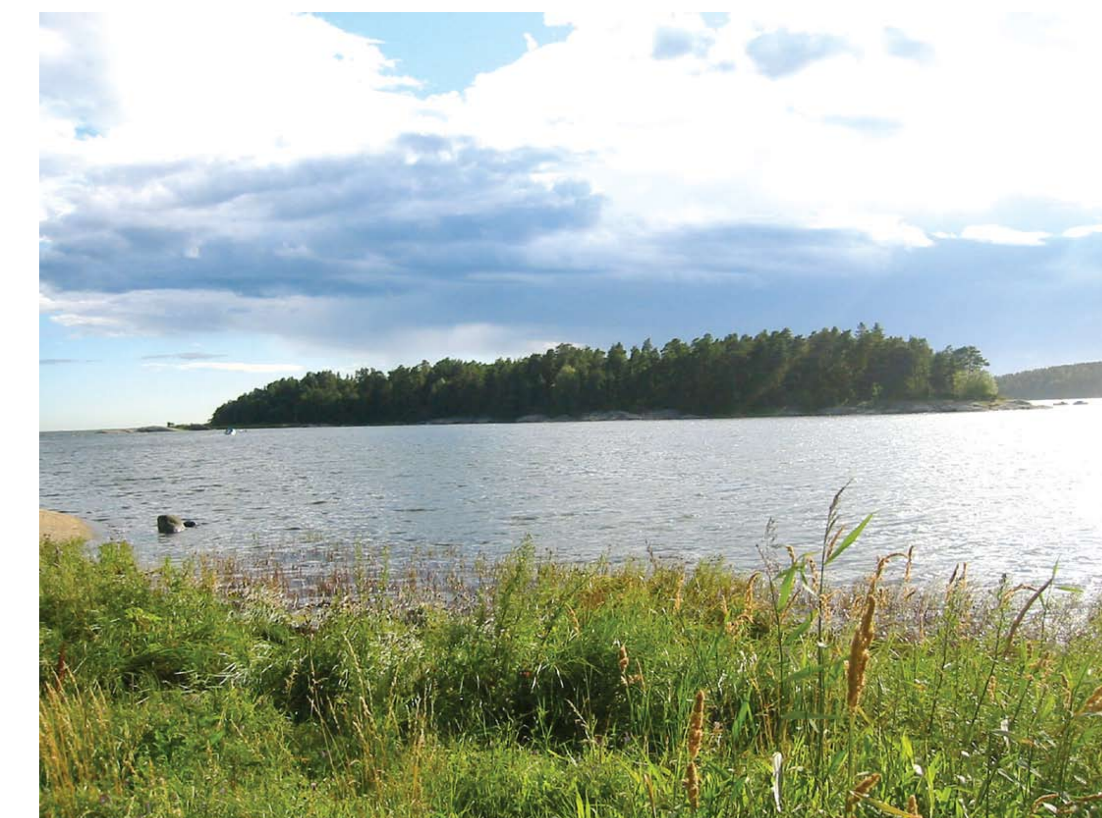
Vrangben med flere gravrøyser fra bronsealder