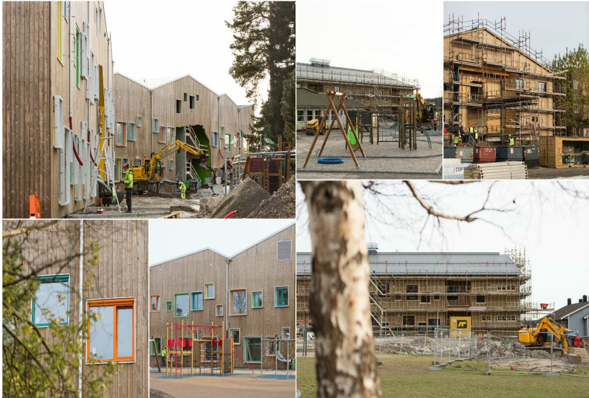
Nye skolebygg Spetalen og Karlshus