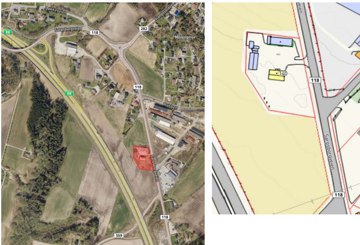
Figur 1: Ortofoto og kartusnitt av området (utklipp fra Råde kommunes kartportal)