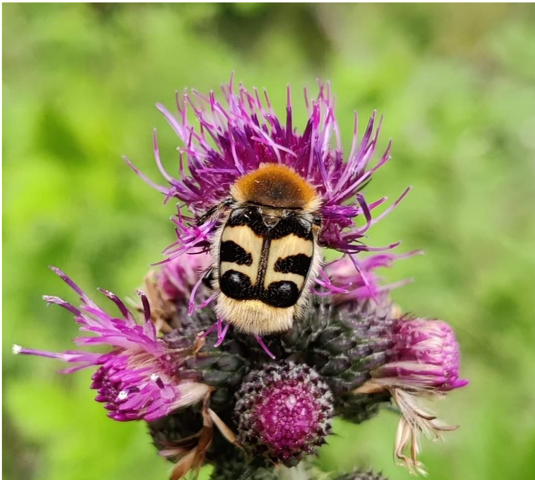
Humlebille på åkertistel.

Ved store tap og likviditetsproblemer kan du søke om forskuddsutbetaling. Dette gjøres via det ordinære søknadsskjemaet i Altinn. Du kan søke om maks 50%. Manglende opplysninger og dokumentasjon må ettersendes så raskt dette foreligger. Beslutning om eventuell forskuddsutbetaling gjøres av statsforvalter.