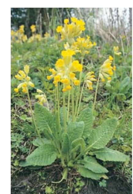
Maria nøkleblom (Primula veris) Rådes kommunebloomst

Mer informasjon om kyststien finner du på Råde kommunes hjemmeside: www.rade.kommune.no