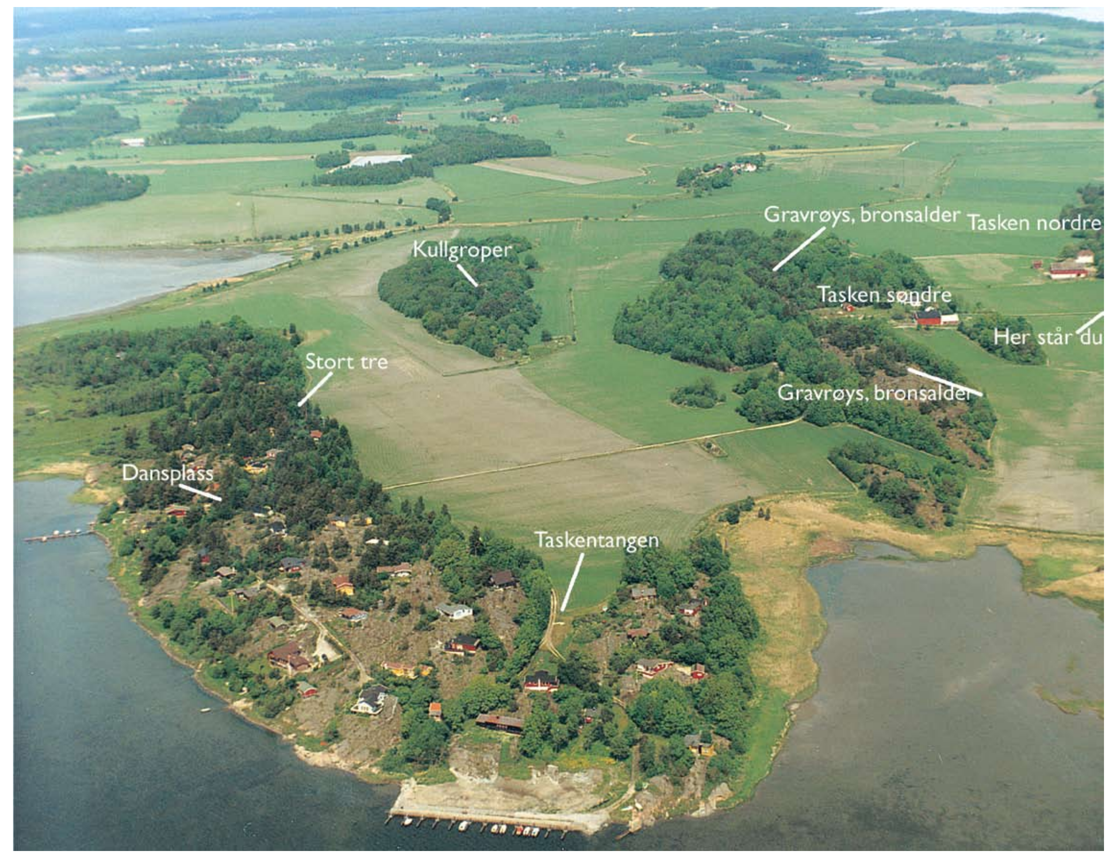
Tasken med Rygge og Kurefjorden i bakgrunn