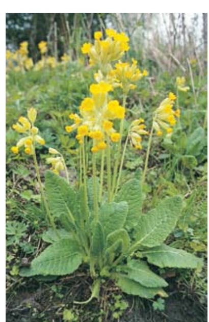
Marianekleblom (Primula veris) Rådes kommunebloss

Mer informasjon om kyststien finner du på Råde kommunes hjemmeside: www.rade.kommune.no