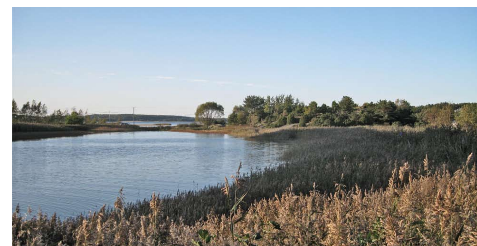
Innerste del av Ovensundet