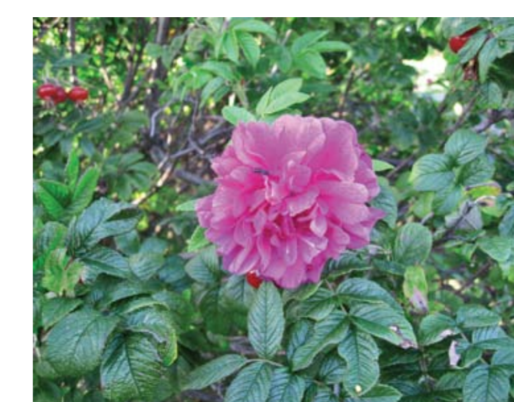
Rosebusker finnes det mye av langs strandkantene på Kyststien.

Mer informasjon om kyststien finner du på Råde kommunes hjemmeside: www.rade.kommune.no