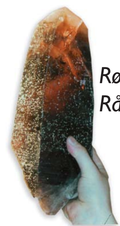
Røykkvarts er Rådes kommunesten