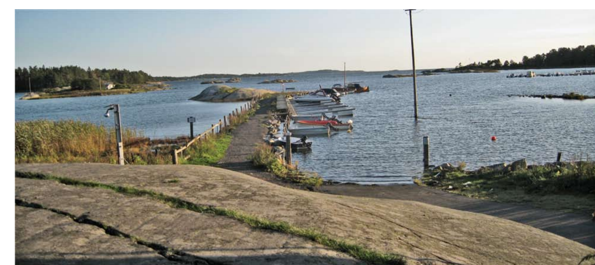
Mot Katteskjær og Svartskjær