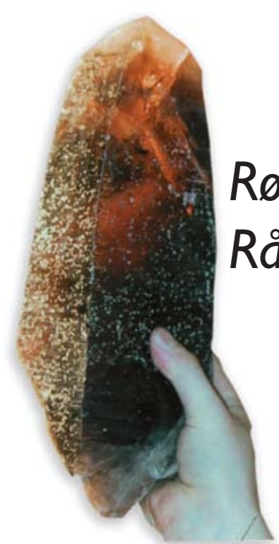
Røykkvarts er Rådes kommunesten