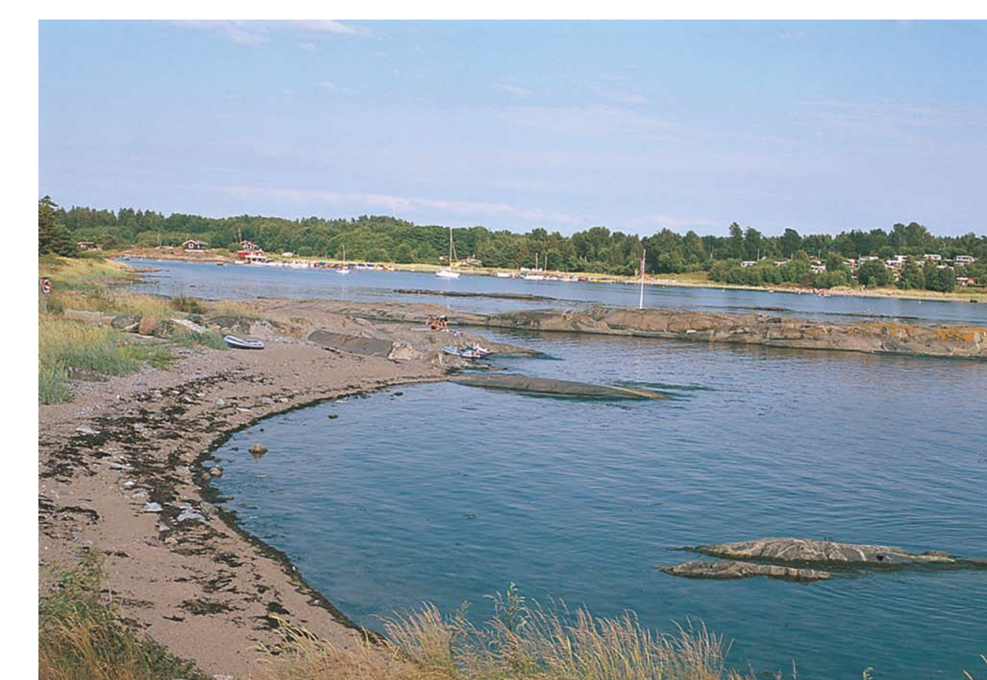
Hesteholmen med Fristranda i bakgrunn

For mer informasjon om kyststien: Råde kommune, tlf: 69 29 50 00 E-post: post@rade.kommune www.rade.kommune.no