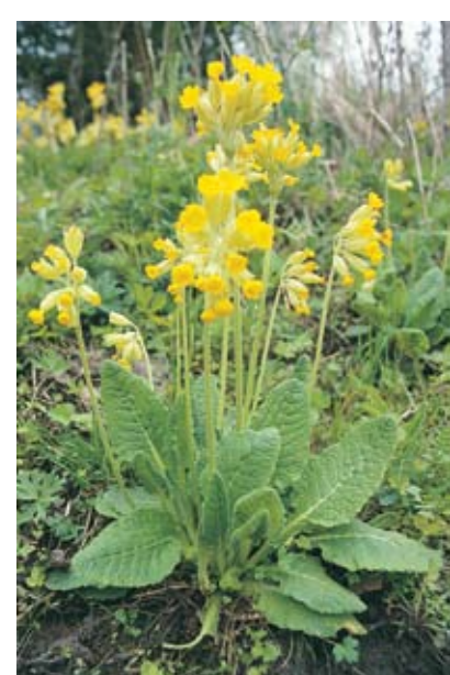
Maria nøkkelblom er Rådes kommuneblomst

Viktige samarbeidspartnere har dessuten vært lokalforeninger som historielag, idrettslag, velforeninger og andre.