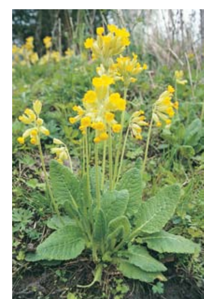
Maria nøkkelblom er Rådes kommuneblomst

Viktige samarbeidspartnere har dessuten vært lokalforeninger som historielag, idrettslag, velforeninger og andre.